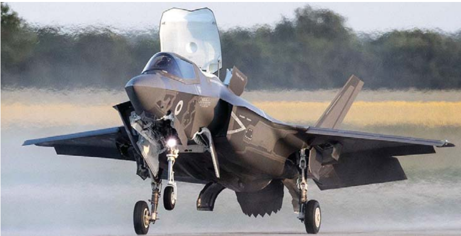
F-35B של חיל האוויר המלכותי נוחת אנכית בבסיס מרהם בבריטניה ב-6 ביוני אחרי הגיעו בטיסה מארה"ב.