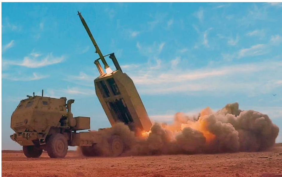
רקטת GMLRS משוגרת ממטגר HIMARS של צבא ארה"ב.

במשך יותר מ-40 שנים, לוקהיד מרטין טילים ובקרת-ירי היא המתכנת והיצרנית המובילה של פתרונות תקיפה מדויקת קרקע-קרקע לטווחים ארוכים, שמשפיקת מערכות אמינות ומוכחות בלחימה דוגמת ATACMS, HIMARS, MLRS ו-GMLRS ללקוחות אמריקניים ובינלאומיים. ■