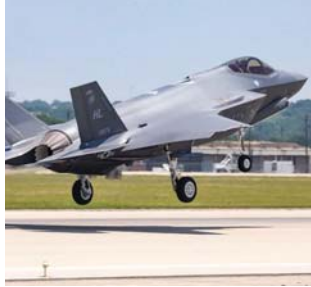
מטוסי קרב מהדור החמישי: הפנטון ולוקהיד מרטיין מסרו את המטוס ה-35F בסדרת הייצור של ה-35F.