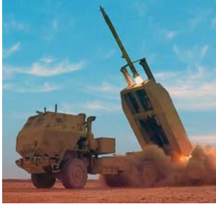
טילים ובקרת ירי: צבא ארה"ב העניק חוזה בסך 828 מיליון דולר לייצור רקטות מנוחה GMLRS.