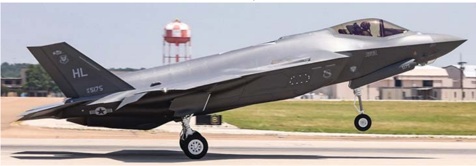
המטוס ה-300 הוא F-35A של חיל האוויר האמריקני שיופעל מבסיס היל ביוטה.

300 המטוסים הראשונים כוללים 197 מטוסי F-35A מהדגם להמראה ונחיתה רגילה, 75 מטוסי F-35B מהדגם להמראה קצרה ונחיתה אנכית, ו-28 מטוסי F-35C מהדגם המיועד לפעולה מסיפון נושאות מטוסים בים, שנמסרו לזרועות הצבאיות בארה"ב וללקוחות בינלאומיים. יותר מ-620 טייסים ו-5,600 אנשי תחזוקה כבר הוכשרו, וצי מטוסי ה-F-35 צבר יותר מ-140,000 שעות טיסה. "ציון דרך זה הוא עדות לעבודה הקשה ולמסירות של הצוות המשותף שלנו לממשלה ולתעשייה, כאשר אנו פועלים יחד לאספקת היכולות המהפכניות של ה-F-35 לגברים ולנשים במדיים", אמר גרג אולמר, סגן נשיא והמנהל הכללי של תוכנית ה-F-35 בלוקהיד מרטין. "אנו